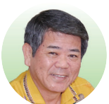
副知事 照屋 義実