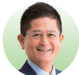
南城市長 瑞慶覧 長敏