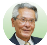
宮古島市長 座喜味 一幸