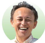
沖縄県知事 玉城 デニー